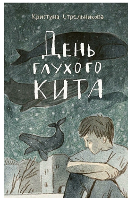
Стрельникова К. День глухого кита : повесть – Санкт-Петербург ; Москва : Речь, 2019. – 96 с. : ил.

Никита случайно разбивает чайник, который был дорог его тёте и сам по себе, и как память об умершей подруге. Мальчик не понимает, почему взрослые так переживают по этому поводу и ждут от него извинений.