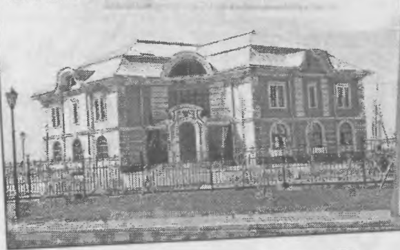
10.08 Коттедж «Смоленск» в Стрельне.