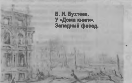
В. И. Бухтеев. У «Дома книги». Западный фасад.

Здание «Дома книги» построили в 1889 году (архитектор Ф. М. Мейшер) для известного смоленского купца Г. П. Павлова. На первом этаже находился магазин модных иностранных вещей, на втором - жилые апартаменты, на третьем - зимний сад. После революции в здании разместился книжный магазин, выше - различные организации. На третьем этаже - Дом работников просвещения, где бывали М. В. Исаковский, А. Т. Твардовский, Н. И. Рыленков. В годы войны здание «Дома книги» сильно пострадало. После войны здесь находились издательства «Московский рабочий», «Смядынь» и др. организации.