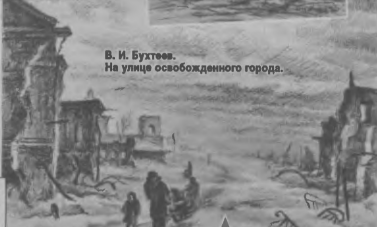
В. И. Бухтеев. На улице освобожденного города.

«Пустырь угрюмый и безводный...» - так охарактеризовал А. Т. Твардовский Смоленск после освобождения. Город был практически уничтожен гитлеровцами. Смоленск утратил 6 550 зданий - 93 процента жилого фонда, 120 промышленных предприятий, 33 школы, 26 больницы, водопровод, трамваи, электростанции и т. д.