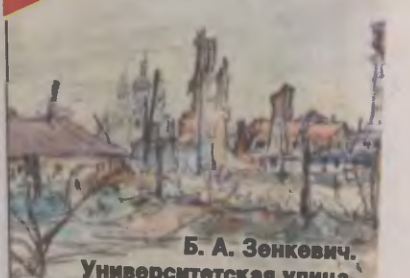
Б. А. Зенкович. Университетская улица.