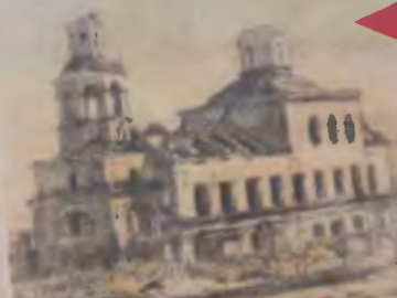
А. С. Дихтяр. Вознесенский монастырь.

На рисунке - сильные разрушения на улице Большая Университетская (бывшая Большая Вознесенская, с 1939 года - ул. Пржевальского). Улица располагалась в самом центре Смоленска и до войны была одной из самых оживленных, заполненных молодежью и преподавателями Смоленского государственного университета, а с 1930 года - педагогического института (в тот год университет разделили на два института - педагогический и медицинский). Педагогический остался в здании бывшего женского епархиального училища. Во время войны было разрушено не только здание института, но и все общежития, обсерватория, фундаментальная библиотека.