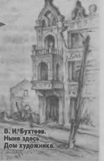
В. И. Бухтеев. Ныне здесь Дом художника.

До войны на улице Большая Советская было более 60 домов, построенных в конце 19-го - начале 20-го века. В основном - магазины и административные здания, на вторых и третьих этажах которых проживали смоляне. В первые же дни войны большинство зданий пострадало от налетов немецкой авиации, в том числе и красивый дом в стиле модерн, в котором до войны располагалось смоленское товарищество «Художник». Сейчас в нем Дом художника.