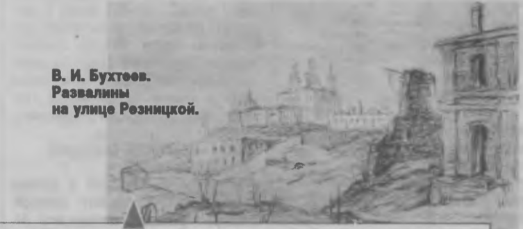
В. И. Бухтеев. Развалины на улице Резницкой.

Улица Резницкая (после 1917 г. - ул. Парижской Коммуны) - одна из древнейших улиц города, проходит параллельно ул. Б. Советской. По преданию, улицу, в древности называвшуюся Родницкой, после кровавой сечи, которая произошла здесь во время обороны Смоленска от поляков в начале 17-го века, народ переименовал в Резницкую. Во время оккупации города здесь проводились массовые расстрелы советских военнопленных и мирных граждан. А Резницкий овраг стал местом захоронения тысяч людей. После войны в память о погибших близ пересечения улиц Козлова и Парижской Коммуны установили небольшой обелиск, а в 1973 году соорудили мемориал памяти жертв фашистского террора.