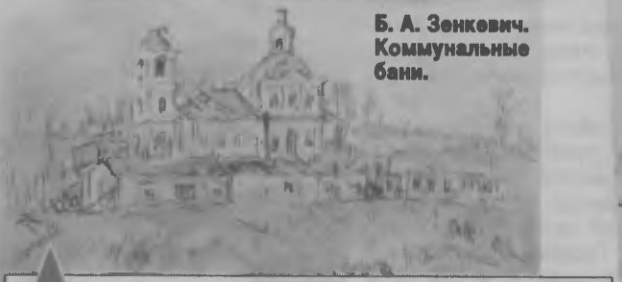
Б. А. Зенкович. Коммунальные бани.