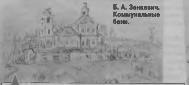
Б. А. Зенкович. Коммунальные бани.