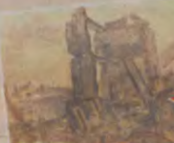
А. С. Дихтяр. Разрушенное здание телеграфа.

В начале улицы Смирнова (ныне - пр. Гагарина), возле Дома печати, в 1930 - 1933 годах военные строители возвели два многоэтажных жилых дома. Поскольку в то время страна работала на стройках под девизом «Пятилетку - в четыре года», то эти дома были построены особым образом. Если на них посмотреть с высоты птичьего полета, то один дом построен в виде цифры пять, второй - четыре. Их называли «домами горсовета». В годы оккупации в одном из них расположилась «фельджандармерия 388». В сентябре 1943 года, во время освобождения Смоленска, эти дома-цифры были сильно разрушены. И до нашего времени дошел только один дом - «отличник». Сегодня это дома №6 и 8 по пр. Гагарина.