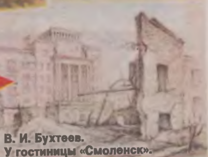
В. И. Бухтеев. У гостиницы «Смоленск».

Здание соборной церкви Вознесенского монастыря было построено в 1933 - 1704 годах. В конце 19-го - начале 20-го века обитель активно занималась социальной и культурно-просветительской деятельностью. В 1929-м монастырь был закрыт. В нем размещались курсы противовоздушной обороны, горсовет ОСО (особое совещание при НКВД СССР), клуб печатников, склад. Здания монастыря сильно пострадали в годы войны. В 1969 - 1971 гг. реставрированы и приспособлены под выставочный зал музея-заповедника. 28 августа 2009 года здания монастыря были переданы Смоленской епархии.