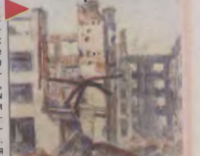
А. С. Дихтяр. Разрушенные жилые дома им. Третьей пятилетки.

На пересечении улиц Ленинской и Почтамтской (ныне - Ленина и Коненкова) с дореволюционных времен стояло красивое здание, в котором располагалось Общество взаимного кредита. В 1930-е годы в нем находились центральный телеграф и АТС. В отличие от стоявшего рядом главпочтамта, разрушенного прямым попаданием авиабомбы в июне 1941-го, это здание в период оккупации уцелело. Однако было взорвано немцами при отступлении в сентябре 1943-го. Впоследствии на его месте построили гостиницу (ныне - «Смоленскотель»).