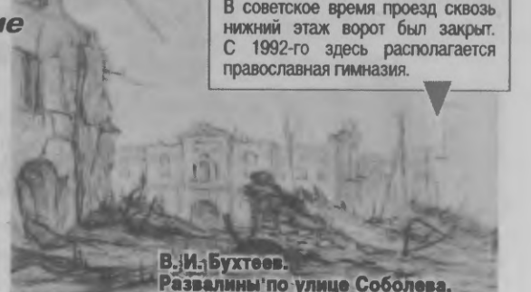
В. И. Бухтеев. Развалины по улице Соболева.

Через развалины жилых домов на улице Соболева видна Одигитриевская надвратная церковь, выстроенная на месте обветшалой Фроловской крепостной башни (Днепровские ворота). Башню разобрали в начале 18-го века, в 1728 году на ее месте возвели деревянную церковь Рождества Богородицы и поместили сюда Смоленскую икону Божией Матери, привезенную в Смоленск в 1602 году Борисом Годуновым. В 1793 - 1800 гг. церковь перестроили в камне. Существующее «здание ворот» сооружено в 1811 - 1812 гг. По преданию, в 1812-м Наполеон с балкона этого храма стрелял вслед уходящим русским войскам. В годы Великой Отечественной Одигитриевская церковь сильно пострадала. В советское время проезд сквозь нижний этаж ворот был закрыт. С 1992-го здесь располагается православная гимназия.