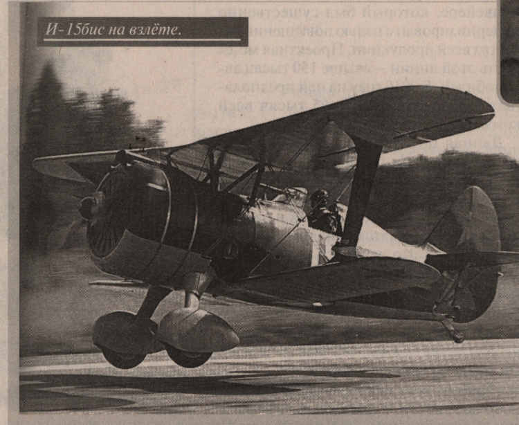
И-15бис на взлёте.