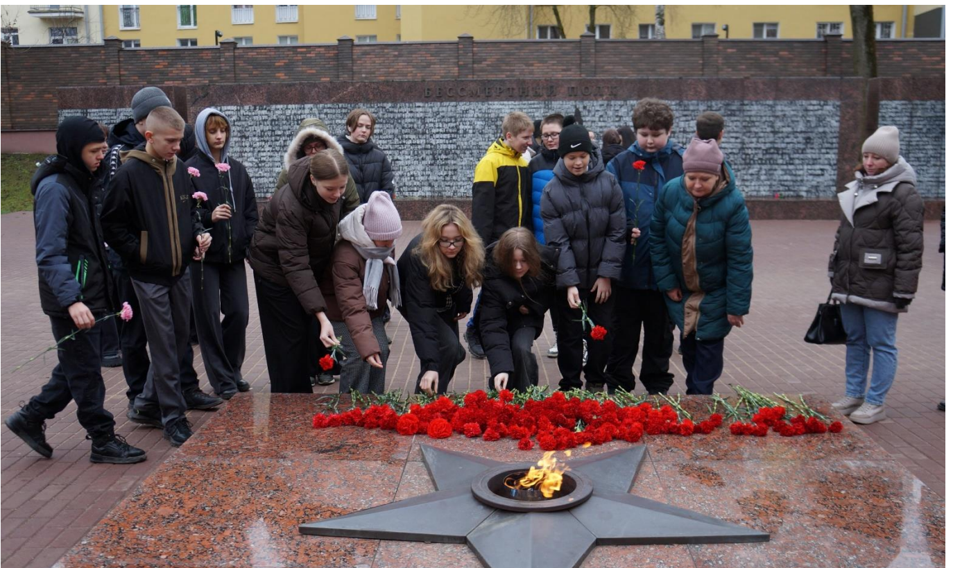
Памятные патриотические мероприятия ко Дню Неизвестного Солдата