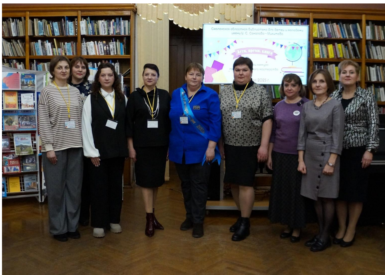
Конкурс профессионального мастерства «Библиотекарь года – 2025»